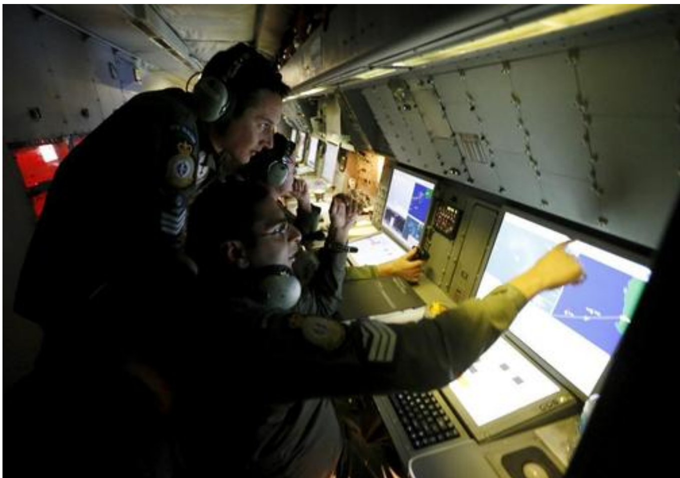
Fuerzas aéreas de Nueva Zelanda buscan con radar el vuelo MH370 en 2014.

Hasta el momento, se han utilizado multitud de enfoques de búsqueda para dar con el paradero del MH370, desde simulaciones oceánicas hasta el análisis bioquímico de los percebes unidos a los restos para averiguar la temperatura del agua a la que fueron expuestos. Sin embargo, en un estudio publicado este martes en la revista Chaos, de AIP Publishing, un equipo internacional de investigadores desarrolla un nuevo enfoque matemático para analizar el movimiento de los restos a la deriva, en el océano.